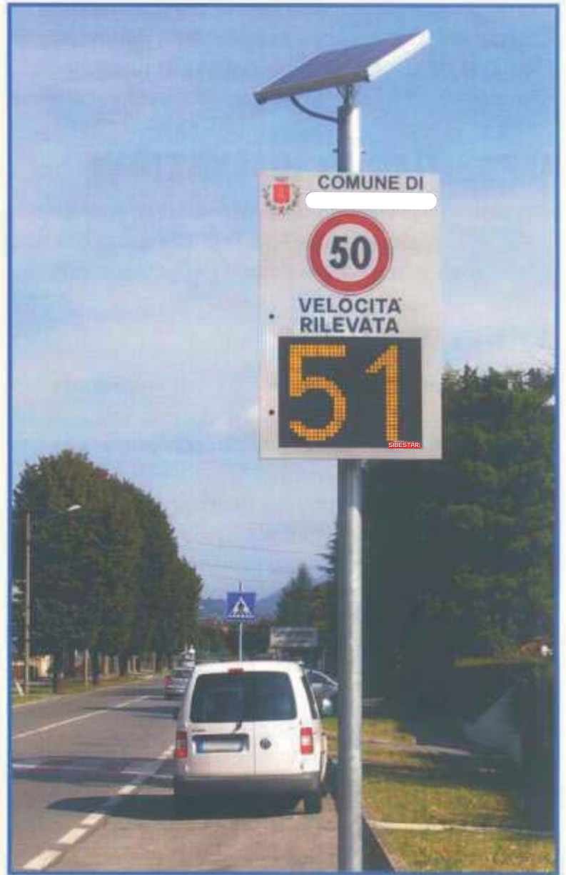
VERSIONE CON PALO CENTRALE